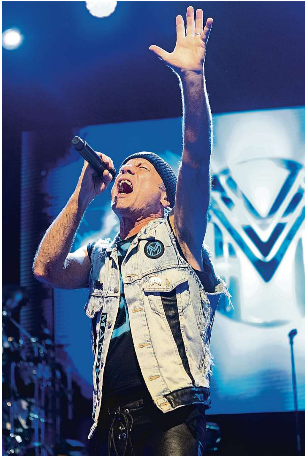
Metalová ikona Po předlouhých devatenácti letech od desky Tyranny of Souls se Bruce Dickinson, frontman heavy-metalových klasiků Iron Maiden, přihlásil se sólovým albem. A ukáže se i na Masters of Rock.

Až letos na jaře vypustil do světa The Mandrake Project, na němž spolupracoval s producentem a kytaristou Royem Z, který v minulosti pracoval také s Judas Priest a Robem Halfordem.