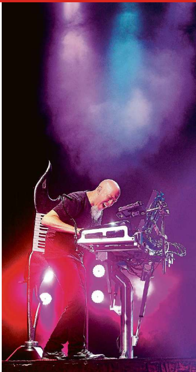
Jordan Rudess Letos je tomu dvacet let od chvíle, kdy se členem kapely Dream Theater stal americký klávesista. Během své kariéry vydal i řadu sólových alb a spolupracoval s dalšími hudebníky.

Mohl bych jich jmenovat celou řadu, ale zmíním aspoň dvě. Arch Echo hrají instrumentální progresivní rock a určitě stojí za pozornost. Special Providence jsou z Madarska a míchají rock/fusion s metalem a progresivní hudbou.